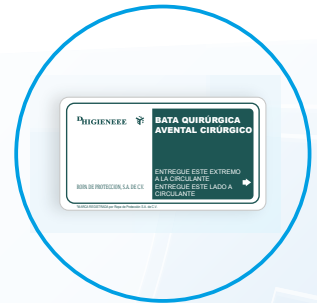
Tarjeta de transferencia